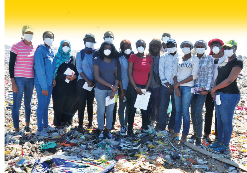
les étudiants du programme Master QHSE en visitent à la Décharge de «mbeubeuss».

A la fin du cursus académique, chaque auditeur devra produire et soutenir publiquement un mémoire de fin de formation devant un jury composé de spécialistes et d'enseignants de haut niveau dans le domaine.